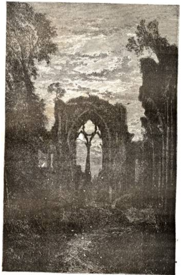
Le clair de lune semble préférer les ruines et les solitudes.

Dès les âges primitifs, l'heure où s'allume l'étoile du berger était attendue par la fiancée qui associait la belle planète Vénus aux plus doux sentiments.