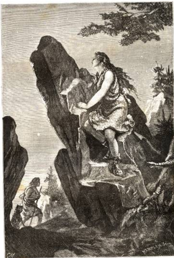
Dès les âges primitifs, l'heure où s'allume l'étoile du berger était attendue par la fiancée, qui associait la belle planète de Vénus aux plus doux sentiments de son cœur.

Dès les âges primitifs, l'heure où s'allume l'étoile du berger était attendue par la fiancée qui associait la belle planète Vénus aux plus doux sentiments.