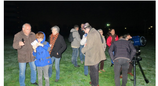
Photo de groupe de cette réunion du 10 mars après la séance de planétarium et avant l'observation. 6 adhérents de l'association ciel d'Anjou étaient présents. Certains observaient déjà (à droite en haut) et ne sont pas présents sur la photo de groupe.

Inauguration de l'escalier le jeudi 16 mars, chez Bernadette à Bonchamps, pour accéder plus facilement au terrain d'observation.